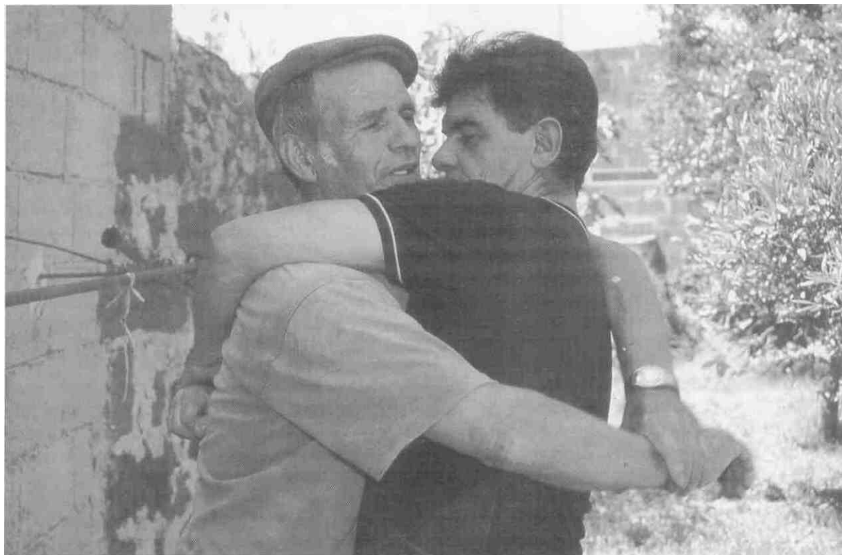
A chintzu partziu.