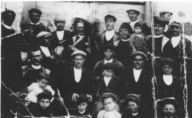
Rugu de zente de sos tempos colaos.